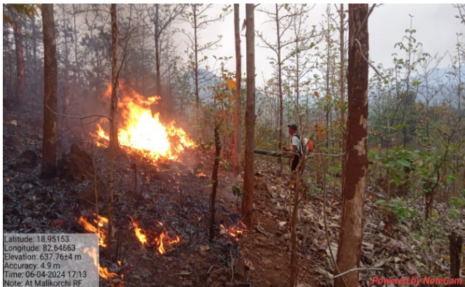
ଜୟପୁର ବନଖଣ୍ଡର ମାଲିକୋର୍ଟି ସଂରକ୍ଷିତ ଜଙ୍ଗଲରେ ବନାଗ୍ନି ନିୟନ୍ତ୍ରଣ