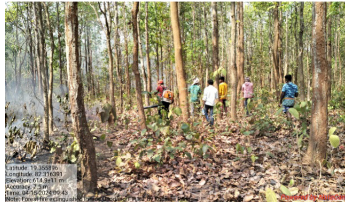
ନବରଙ୍ଗପୁର ବନଖଣ୍ଡ ଦେଓଡ଼ଙ୍ଗରୀ ପ୍ରସ୍ତାବିତ ସଂରକ୍ଷିତ ଜଙ୍ଗଲରେ ବନାଗ୍ନି ନିୟନ୍ତ୍ରଣ କାର୍ଯ୍ୟ