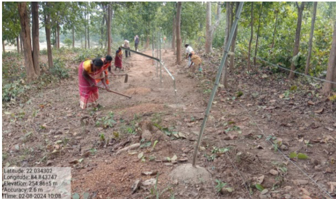
ରାଉରକେଲା ବନଖଣ୍ଡରେ ବନାଗ୍ନି ନିୟନ୍ତ୍ରଣ ପାଇଁ ରୁଖାତୋଳା ବନ ସୁରକ୍ଷା ସମିତିରେ ଅଗ୍ନିରେଖା ସୃଷ୍ଟି