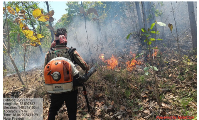
ବଲାଙ୍ଗୀର ବନଖଣ୍ଡ ଅନ୍ତର୍ଗତ ଆମ ଜଙ୍ଗଲ ଯୋଜନାର ବନ ସୁରକ୍ଷା ସମିତିରେ ବନାଗ୍ନି ନିୟନ୍ତ୍ରଣ