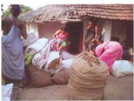
ପରିମାଣ ଅନୁସାରେ ବିକ୍ରି କରନ୍ତୁ ନାହିଁ.....