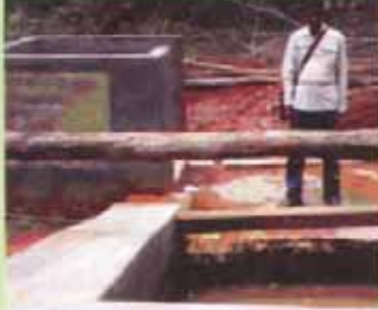
ମହିଳାଙ୍କ ପାଇଁ ଗାଧୁଆ ଘର

ବାଲିଗୁଡ଼ାରେ ପ୍ରଦେଶିକା କାର୍ଯ୍ୟର ଛାଞ୍ଚ ପ୍ରସ୍ତୁତିବେଳେ କେତେକ ବନ ସଂରକ୍ଷଣ ସମିତି ଅଞ୍ଚଳରେ ମହିଳାମାନଙ୍କ ପାଇଁ ଗାଧୁଆ ଘର ନିର୍ମାଣକୁ ପ୍ରାଥମ୍ୟ ଦିଆଯିବ ବୋଲି କ୍ଷିତ୍ରି କରାଯାଇଥିଲା । ଉତ୍ତମ ପ୍ରଥମ ଓ ଦ୍ୱିତୀୟ ବର୍ଷ ଅଞ୍ଚଳର ଛଅଟି ବନ ସଂରକ୍ଷଣ ସମିତିରେ ଗାଧୁଆ ଘର ନିର୍ମାଣ କରାଯାଇଛି । ଏଥିଯୋଗୁଁ ମହିଳାମାନଙ୍କ ମୁହଁରେ ହସ ପୁଟିଛି ଓ ସେମାନେ ନିଶ୍ଚିନ୍ତରେ ଗାଧୋଇପାରୁଛନ୍ତି । ଏହି ଛୋଟ ପଦକ୍ଷେପ ଯୋଗୁଁ ପ୍ରକଳ୍ପ ମହିଳାମାନଙ୍କ ହୃଦୟ ଜିତିପାରିଛି ।