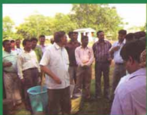
ଅନୁସୋନ ଠାରେ ଜୈବ ଖତ ପ୍ରଶିକ୍ଷଣ କେନ୍ଦ୍ର