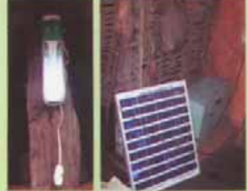
ବେଲଗର କ୍ଷେତ୍ର ଅନ୍ତର୍ଗତ ରଙ୍ଗାପାଡ଼ୁ ବିଏସଏସରେ ସୌରଚାଳିତ ଆଲୋକ ବ୍ୟବସ୍ଥା

ବେଲଗର କ୍ଷେତ୍ର ପରିଚାଳନା ସ୍ଥାନିତ ଅଧୀନରେ ରଙ୍ଗାପାଡ଼ୁ ବନ ସଂରକ୍ଷଣ ସମିତି ଏକ ଅତ୍ୟନ୍ତ ଆରାଧ୍ୟତା ଗୁଣ ଓ ସେଥିରେ ପ୍ରାୟତଃ ଦୁର୍ଗତ ବନ୍ଦ ବସବାସ