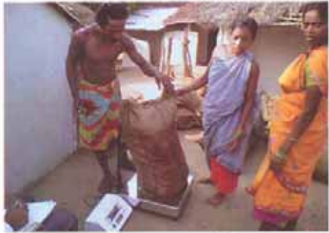
.....ଓଜନ ଅନୁସାରେ ବିକ୍ରି କରନ୍ତୁ ଓଡ଼ିଶା ବନାଞ୍ଚଳ ଉନ୍ନୟନ ପ୍ରବନ୍ଧ ସହଯୋଗପ୍ରାପ୍ତ କେନ୍ଦ୍ରୀୟ ଉନ୍ନୟନ ପରିଚାଳନା କେନ୍ଦ୍ରର ଉଦ୍ଦେଶ୍ୟ ବନ ସଂରକ୍ଷଣ ସମିତିରୁ ଏହାର ଶ୍ରେୟ ଗଠନ ।