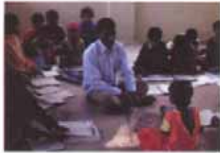
କୈଳାସପୁରର ପିଲାମାନେ ଡିଏସ୍‌ଏସ୍ ସଭାଗୃହରୁ ପାଠ ପଢ଼ନ୍ତି ।

ରାୟଚତ୍ରା ବିଭାଗ ପାହାଚ ଉପରେ ଥିବା କୈଳାସପୁର ଏକ ଛୋଟ ଗ୍ରାମ ଓ ସେଠାରେ ୧୨୧ଟି ପରିବାର ରହନ୍ତି । ଏହା ଏକ ଗ୍ରାମପଞ୍ଚାୟତ ମହକୁମା ଏବଂ କୋଇଳରା ବୁର୍ଜାରୁ ୧୫ କି.ମି ଦୂରରେ ଅବସ୍ଥିତ । ଗ୍ରାମରେ ମୁଖ୍ୟତଃ 'କନ୍ଧ' ଆଦିବାସୀ ରହନ୍ତି ଓ ସେମାନେ ବନଜାତ ଦ୍ରବ୍ୟ, ପଶୁପାଳନ ଓ ପୋଡ଼ୁ ଚାଷ ଉପରେ ନିର୍ଭର କରନ୍ତି ।