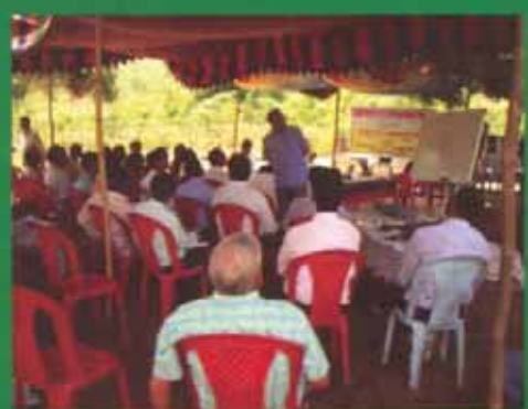
ରାୟଭରା ଠାରେ ଜୈବ ଖତ ପ୍ରଶିକ୍ଷଣ କେନ୍ଦ୍ର

ପ୍ରଶିକ୍ଷାଧୀନୀମାନେ ଏହି କୃତନ ଚାଲିମରେ ପ୍ରଦାସିତ ହୋଇ ବିକେନ୍ଦ୍ରୀକୃତ ନର୍ସରୀରେ ଜୈବ ଖତ ବ୍ୟବହାର ଉପରେ ଗୁରୁତ୍ୱ ଦେବା ସହ ଜୈବ ଖତ ପ୍ରସ୍ତୁତିକୁ ବିକଳ ଜାଣିବା ନିର୍ବାହ ପଛାଚାଚୋ ପ୍ରୋତ୍ସାହନ ଦେବାକୁ ସମ୍ମତ ହୋଇଥିଲେ । ଉପାୟନିକ ସାରର ବିନା ବ୍ୟବହାରରେ ଉତ୍ପାଦିତ ଶସ୍ୟ ସ୍ୱାସ୍ୟ ସମାସ୍ୟା ଲାଗିବ କଲେ ଏହା ଏପରି ଶସ୍ୟ ଉତ୍ପାଦନ ପାଇଁ ପ୍ରୋତ୍ସାହନ ଦେବା ପାଇଁ ଓଡ଼ିଶା ବନାଞ୍ଚଳ ଉନ୍ନୟନ ପ୍ରକଳ୍ପ ଆଶା ରଖିଛି ।