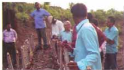
ମୃତ୍ତିକା ସଂରକ୍ଷଣ କାର୍ଯ୍ୟ

ଓଡ଼ିଶା ପ୍ରଦେଶୀୟ ଉପକ୍ରମ ଉପରେ ସର୍ବିତ୍ତ କନସରଭାସ୍ତ୍ରୀ ଦ୍ୱାରା ରାୟଗଡ଼ାରେ ମୃତ୍ତିକା ଓ ଜଳ ସଂରକ୍ଷଣ ଉପରେ ଏକ ପାଠଦର୍ଶିଆ ଚାଲିମ କାର୍ଯ୍ୟକ୍ରମ ଅନୁଷ୍ଠିତ ହୋଇଥିଲା । ପ୍ରାକୃତିକ ସମ୍ପଦ ପରିଚାଳନା, ମୃତ୍ତିକା କ୍ଷୟ ଓ କ୍ଷୟ ନିୟନ୍ତ୍ରଣ ପାଇଁ ପଦକ୍ଷେପ, ନୀଳ ଉପତୀର ଏବଂ ମୃତ୍ତିକା ମାତ୍ରା ଗଣନା ଓ ତାହାର ଉପତୀର ପ୍ରକୃତି ଏହି ଚାଲିମ କାର୍ଯ୍ୟକ୍ରମର ପ୍ରମୁଖ ବିଷୟ ଥିଲା । ଏହି ଚାଲିମ କାର୍ଯ୍ୟକ୍ରମରେ ସୀମା ସଂସ୍ଥାପନ ମ୍ୟାପ ପଠନ, ମୃତ୍ତିକା ଉପତୀରର ବିଭିନ୍ନ ମାଧ୍ୟମ ଏବଂ ଉପଯୁକ୍ତ ସମୟରେ ପ୍ରୟୋଗ