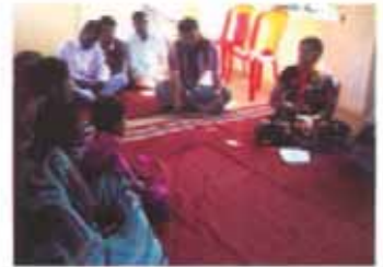
ଡିଏସ୍‌ଏସ୍ ସଭାଗୃହରେ ମନବକେନ୍ଦ୍ରୀୟ ଏବଂବହିର ଚର୍ଚ୍ଚା ।

ଗ୍ରାମବାସୀ ଏହି ସଭାଗୃହକୁ ଏକ ଶିକ୍ଷା କେନ୍ଦ୍ରଭାବେ ବ୍ୟବହାର କରିବାକୁ ନିଷ୍ପତ୍ତି ନେଲେ । ଅଗଷ୍ଟ ୨୦୦୮ରେ ଗ୍ରାମର ଜଣେ ସ୍ୱେଚ୍ଛାସେବୀଙ୍କ ସହାୟତାରେ ଶିଶୁ ଓ ମହିଳାଙ୍କ ପାଇଁ ଏକ ସାକ୍ଷରତା ଅଭିଯାନ ଆରମ୍ଭ କରିବାକୁ ବନ ସଂରକ୍ଷଣ ସମିତି ନିଷ୍ପତ୍ତି ନେଲା । ଗ୍ରାମର ଶିଶୁମାନେ ପାଞ୍ଚଟା ପରେ ଏବଂ ଶନିବାର ଓ ରବିବାର ସକାଳ ୧୦ଟା ପରେ ସେଠାକୁ ଆସନ୍ତି । ତେବେ ମହିଳାମାନଙ୍କ ପାଇଁ ଶିକ୍ଷାଗୃହର ବ୍ୟବସ୍ଥାକୁ କୋରକ କରାଯାଇଛି । ସେମାନଙ୍କ ମଧ୍ୟରେ ଅଧିକାଂଶ ସ୍ତ୍ରୀ ସହାୟକ ଗୋଷ୍ଠୀର ସଭ୍ୟ ଅଛନ୍ତି । ଶିକ୍ଷା ଦାନ ବ୍ୟବସ୍ଥା ବ୍ୟତୀତ ଏହି ସଭାଗୃହରେ ସ୍ତ୍ରୀ ସହାୟକ ଗୋଷ୍ଠୀର ସଭା, ପଢ଼ା ସଭା, ଗ୍ରାମ ସଭା ଓ ଅନ୍ୟ ଉନ୍ନତ ଅନୁଷ୍ଠିତ ହୁଏ । ଏହାବ୍ୟତୀତ ଏହି ସଭାଗୃହକୁ ଏକ ସୂଚନା କେନ୍ଦ୍ରଭାବେ ବ୍ୟବହାର କରାଯାଇଛି ।