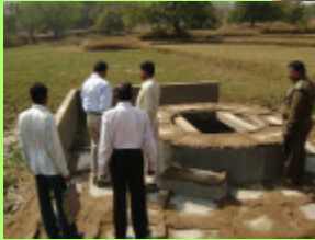
Platform of village well under E.P.A- PAKANAGAON VSS