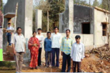
Phulbani - Kaladi VSS