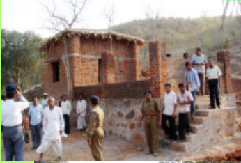
Phulbani - Pakangaon VSS