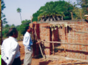
VSS Office-Cum- Meeting Hall at PAKANAGAON Under Construction