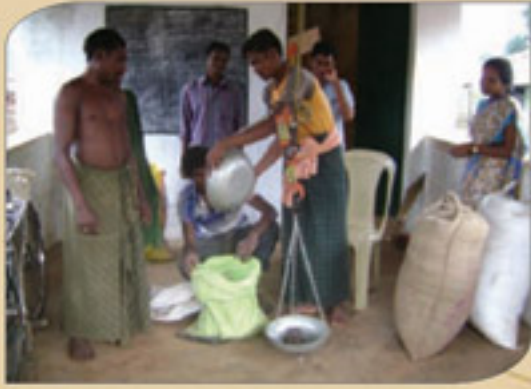
ଆଗରାଣ ଗୋଦାମଭାବେ ଭିଏସଏସ କୋଠାର ବ୍ୟବହାର