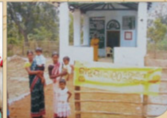
ଟାକାକରଣ ପାଇଁ ଭିଏସଏସ କୋଠାର ବ୍ୟବହାର