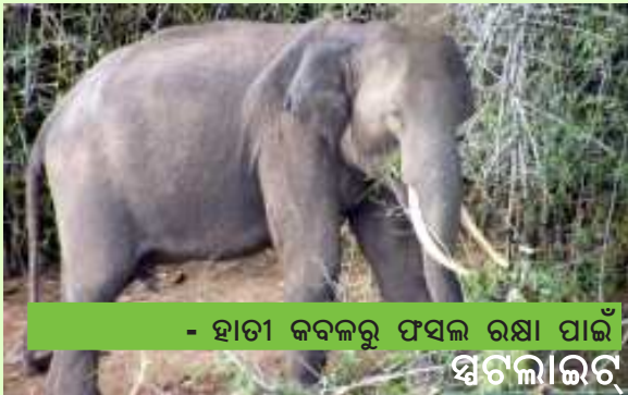
- ହାତୀ କବଳରୁ ଫସଲ ରକ୍ଷା ପାଇଁ ସ୍ୱଚ୍ଛଳାଇତ

ବିରଞ୍ଚି ନାରାୟଣ ପ୍ରଧାନ, ବରିଷ୍ଠ ଏପଇଓ, ଅନଗୁଳ ଡିଏମୟୁ