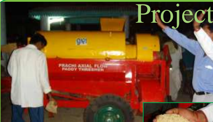
Thrasher procured by Kadapada VSS of Deogarh DMU from Project fund.

Project Director interacting with the community on different activities undertaken in a village of Bichitrapur FMU, Balasore Division.