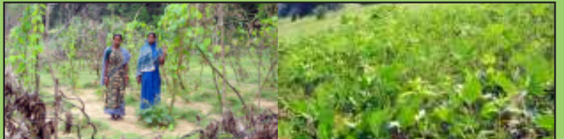
ସ୍ୱୟଂ ସହାୟକ ଗୋଷ୍ଠୀ ହିତାଧିକାରୀଙ୍କ ଠାରୁ ଏକ ପତ୍ର

ବନ ସଂରକ୍ଷଣ ସମିତିର ବିବର୍ତ୍ତନ ପାଣ୍ଠିରୁ ବହୁ ସ୍ୱୟଂ ସହାୟକ ଗୋଷ୍ଠୀ ଅଣୁ ଯୋଜନା ସମ୍ପନ୍ନ କାର୍ଯ୍ୟକଳାପ ପାଇଁ ଆର୍ଥିକ ସହାୟତା ପାଇଛନ୍ତି । ସ୍ୱୟଂ ସହାୟକ ଗୋଷ୍ଠୀଗୁଡ଼ିକ ଏହି ସହାୟତା ଦ୍ୱାରା ଭଲ ଲାଭ ପାଇବା ସହ ପ୍ରକଳ୍ପ ଅଧୀନରେ ଏପରି କାର୍ଯ୍ୟ କରି ଲାଭ ଉଠାଇବାକୁ ଅନ୍ୟମାନଙ୍କୁ ପ୍ରବର୍ତ୍ତାଇଛନ୍ତି । ବାରକୋଟ ରେଞ୍ଜ ଅନ୍ତର୍ଗତ ଗୋଏଲମରା ଗ୍ରାମର ଲକ୍ଷ୍ମୀପାର୍ବତୀ ସ୍ୱୟଂ ସହାୟକ ଗୋଷ୍ଠୀ ବନ ସଂରକ୍ଷଣ ସମିତିରୁ ଆର୍ଥିକ ସହାୟତା ନେଇ ଏପରି ଲାଭବାନ ହୋଇଥିବାରୁ ତାହାର ସଭାପତି ତାଙ୍କର ସେହି ଅଭିଜ୍ଞତାକୁ ଅନ୍ୟମାନଙ୍କ ସହ ବାଣ୍ଟିବାକୁ ଅନ୍ୟ ଏକ ଅଜଣା ବନ୍ଧୁଙ୍କୁ ପତ୍ର ଲେଖିଛନ୍ତି । ଏକ ସ୍ୱୟଂ ସହାୟକ ଗୋଷ୍ଠୀ ଗଠନ କରି ପ୍ରକଳ୍ପର ସାହାଯ୍ୟ ଉଠାଇବାକୁ ସେ ପତ୍ରରେ ପରାମର୍ଶ ଦେଇଛନ୍ତି । ଲକ୍ଷ୍ମୀପାର୍ବତୀ ସ୍ୱୟଂ ସହାୟକ ଗୋଷ୍ଠୀ ସଭାପତି ଲେଖିଥିବା ସେହି ବିସ୍ତୃତ ପତ୍ରର କିୟଦାଂଶ ଏଠାରେ ଉପସ୍ଥାପନ କରାଗଲା ।